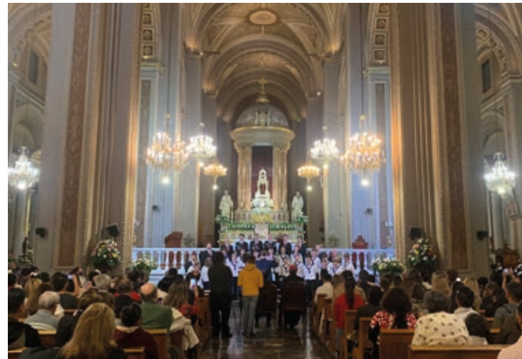
Foto: Ein Konzert in der Kathedrale von Morelia, der schönsten Konzertkirche unserer Reise

9 große Konzerte in Konzerthallen und Kirchen und mehrere kleinere bzw. kürzere Auftritte standen auf dem Programm.