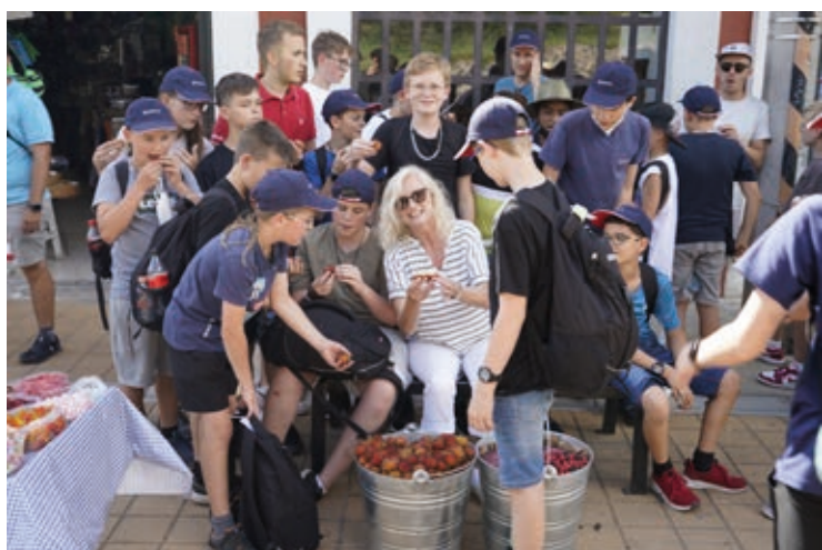
Foto: Litschi- und Kaktusfrüchteverkostung in Cholula