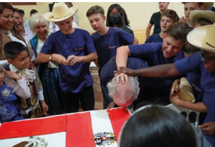
Foto: Mexikanischer Geburtstagsbrauch: Das Gesicht des Jubilars wird in die Geburtstagstorte getunkt