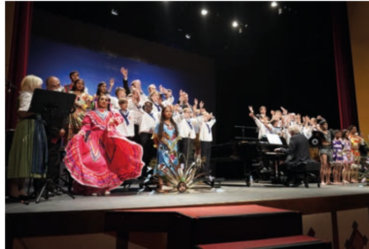
Foto: Konzert in Querétaro

Diese Mexikotournee wird hoffentlich nicht unsere letzte gewesen sein! Mexiko ist immer wieder eine Reise wert! ■