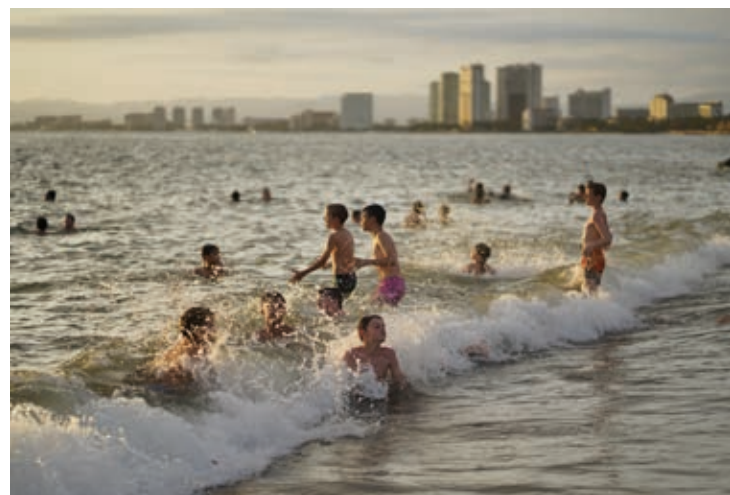
Foto: Badespaß in Puerto Vallarta