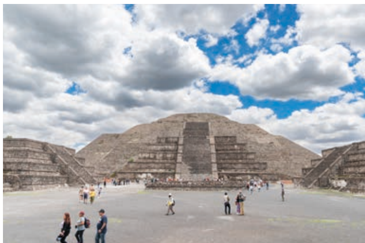
Foto: Auf der Straße der Toten auf dem Weg zur Mondpyramide